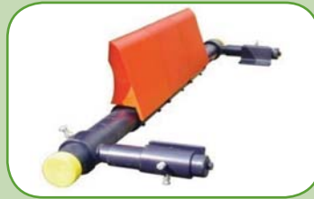
čelní segmentový stěrač typ: Trommel Polyuretan