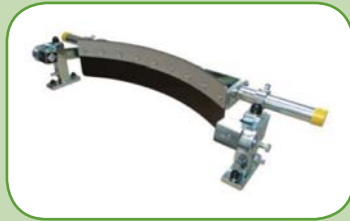
lištový parabolický stěrač typ: Standard Parabol