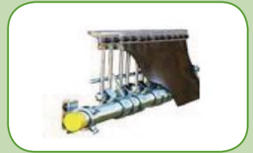
čelní segmentový stěrač typ: Trommel