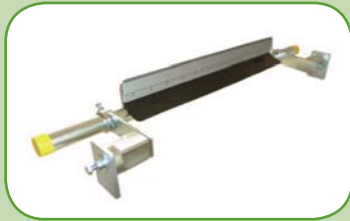
lištový stěrač typ: Standard